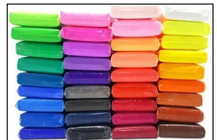
Masa moldeable tipo foami